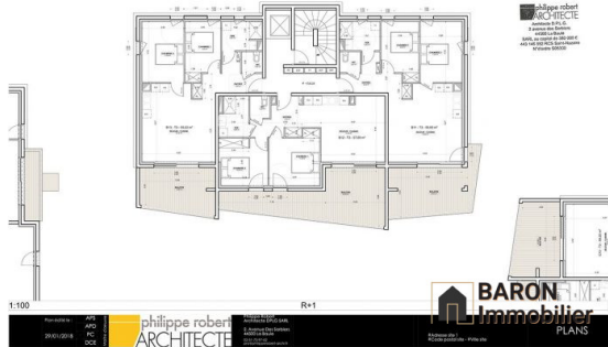
PLANS - B, C, D, E - R+1

BARON Immobilier 26 rue du Petit Parc 33200 Bordeaux www.baronimmo.fr contact@baronimmo.fr 09 53 60 61 64