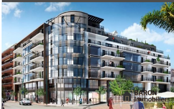
Coup de cœur

Immobilier HT : 109 167 € Total HT : 109 167 € Total TTC : 131 000 € Taux TVA : 20,00 % Prix immobilier TTC (20,00%) : 131 000 €